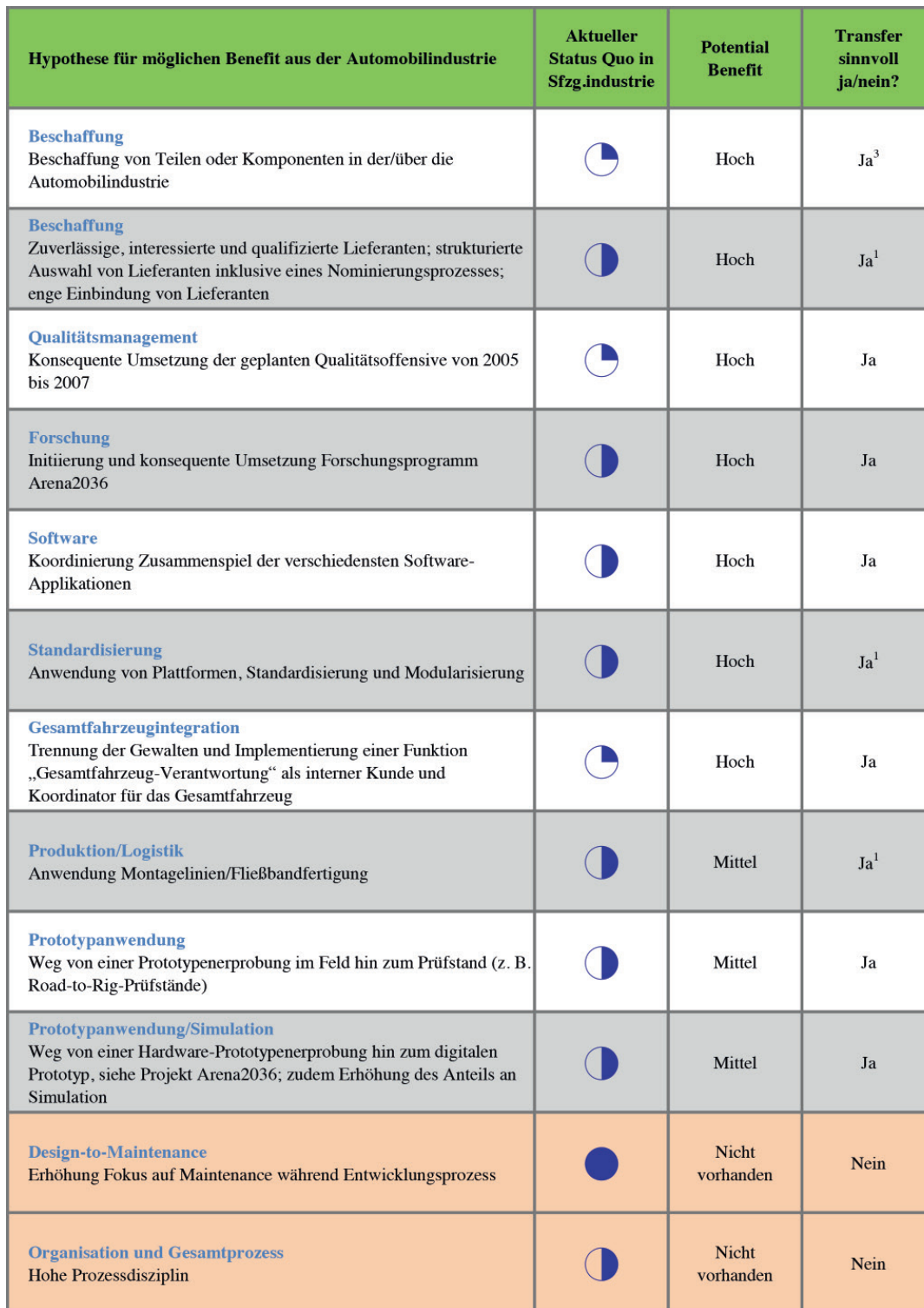
TABELLE 3: Hypothesen und Benefits inklusive Beurteilung, Teil 2